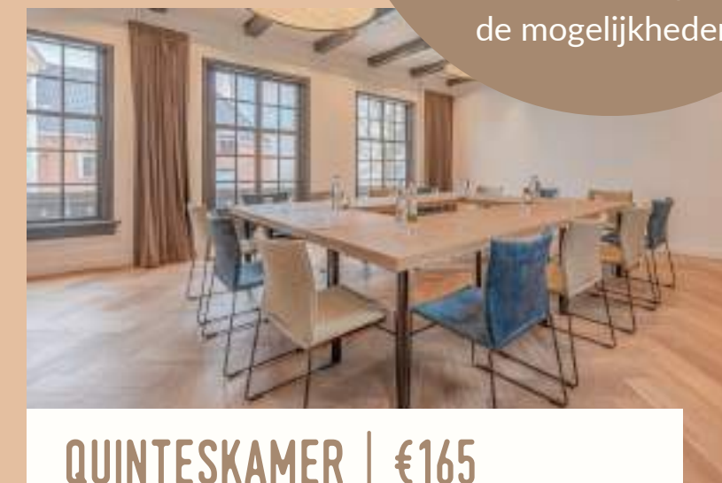
QUINTESKAMER | €165