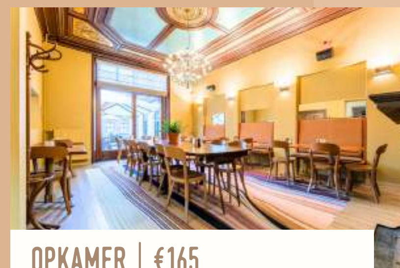
OPKAMER | €165