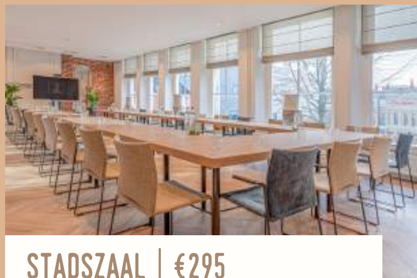
STADSZAAL | €295

Het is mogelijk om zalen te combineren of de bovenverdieping af te huren. Vraag naar de mogelijkheden!