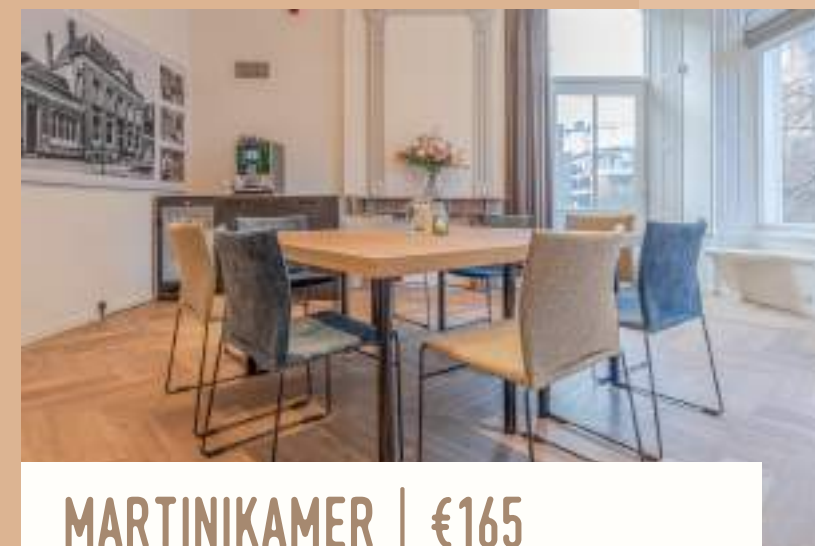
MARTINIKAMER | €165