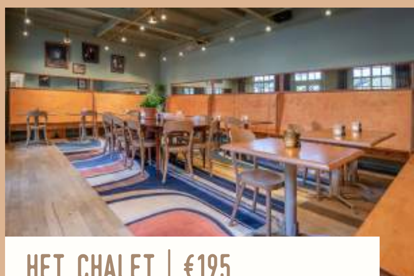
HET CHALET | €195