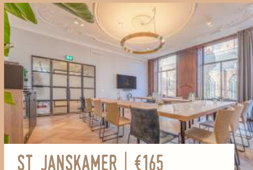
ST JANSKAMER | €165