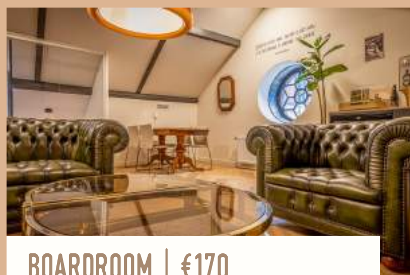
BOARDROOM | €170